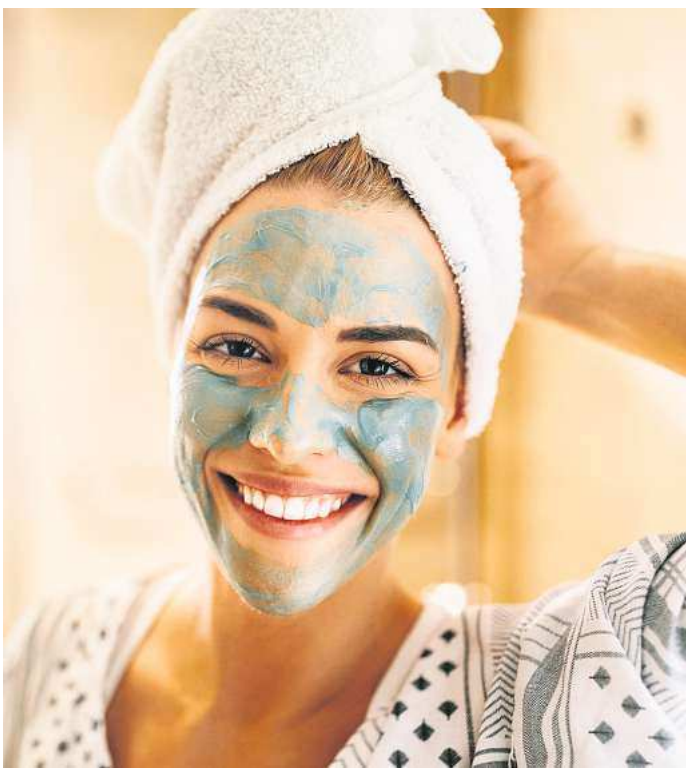
Auch bei winterlichen Temperaturen und trockener Heizungsluft wird Problemhaut mit der richtigen Pflege wieder streichelzart.

Vorsichtig wachrubeln: Ist die Haut trocken und neigt zu Schuppchenbildung, wirkt ein sanftes Peeling gleich dreifach. Es entfernt abgestorbene Hautzellen, regt die Durchblutung an und sorgt dafür, dass die anschließende Pflege besser aufgenommen wird. Aber Achtung: Gerade bei sensibler Gesichtshaut sollte das Peeling nicht zu grobkörnig sein. Tipp: Etwas basisches Körperpflege-salz in die Hände geben und die feuchte Haut in kreisenden Bewegungen leicht massieren. Anschließend mit klarem Wasser